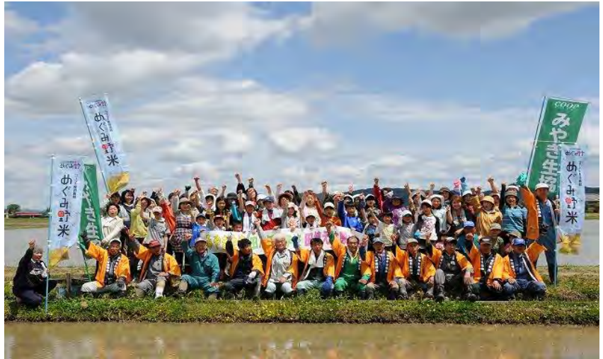
参加者による集合写真

当日は天候にも恵まれ、お子さんを含め66人もの生協メンバーさんが集まり、約3反歩の田んぼに2時間かけて1人一列