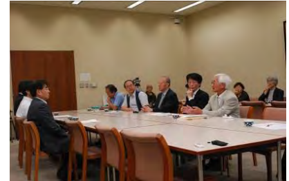
宮城県への申し入れの様子

6月9日(月)宮城県生協連、あいコープと市民団体は共同して、宮城県に対して以上のような趣旨の申し入れを行いました。