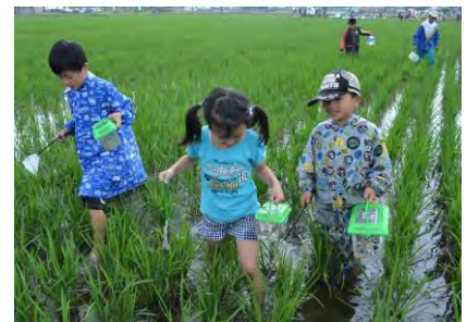
5月に植えた苗はひざ上までに成長していました。