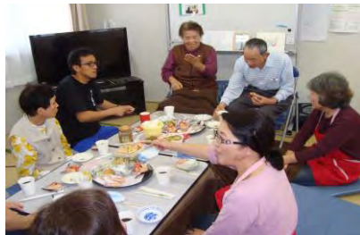
↑ボラセンニュース Vol.100 記念号

活動の様子やボランティア募集など、情報満載のボラセンニュースは、HPに掲載しています。 みやぎ生協「復旧・復興をめざして」 URL http://www.miyagi.coop/support/shien/ ▲松川信託住宅でのお茶会の様子