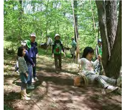
森の中で楽しく遊ぶ子どもたち