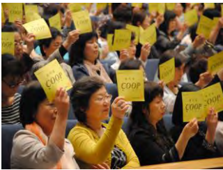
総代証を掲げる 総代の皆さん

ご来賓として村井嘉浩宮城県知事など3人にお越し頂き、総代定数1,100のうち、1,073人（代理、委任含む）の総代が出席、提案した10議案はいずれも