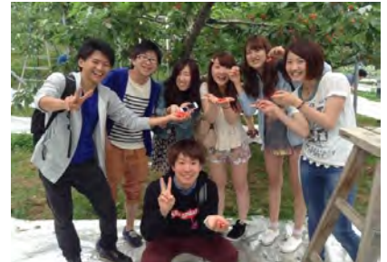
さくらんぼ狩りを楽しむ学生たち