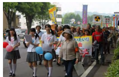
アピール行進の様子

となりました。参加者は「多くの人が集まった」「内容も良かった」と話していました。