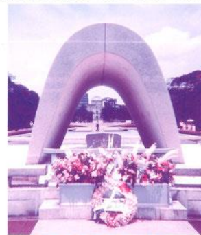
広島平和都市記念碑

被爆体験者と高校生との共同制作による原爆の絵 「原爆と人間展」パネルを展示 原爆被害の実相を写真で伝え、平和の大切さを共に考えましょう。