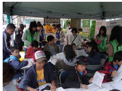
大勢の子どもたちが MELONの「エコ検定」に挑戦

来場者は、環境省や仙台市のブースでパネルを見たり、ゲームをしたりしながら、リサイクルや分別に