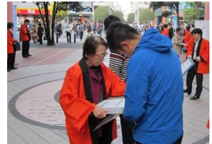
消費税増税に反対の署名活動の様子

一番大事な事は、庶民の生活最優先の政策で景気を良くすることです。そのため消費税率の10%への引き上げに断固反対することを広く県民に訴えるため、10月24日(金)3団体共同(消