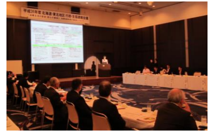
板東久美子消費者庁長官の講演の様子

その後、秋田県県民生活課より「秋田県の現状と消費者教育について」、秋田県生協連より「秋田県生協連の取り組み」、日本生協連より「全国の生協の取り組み」、宮城県生協連の野崎和夫専務理事より「被災者生活再