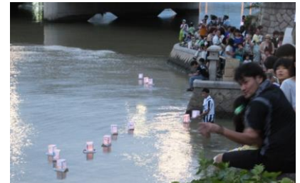
平和を願う灯ろう流しの様子

多くの人と意見を交わす中で、人の意見は本当に人それぞれなのだと感じました。式典に参加した理由も人によって皆違ったし、同じものを見て、学んできても感じ方、伝え方は人それぞれだったからです。戦争や核に関する問題にもいろいろな意見があっていいと思います。