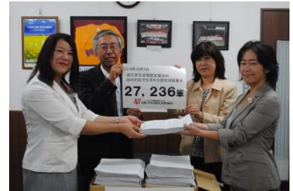
大阪いずみ市民生協様より 署名の引き渡しの様子

ことは地域への定住を促し、地域の活力やコミュニティを保つことにつながります。今後、この署名は来年の通常国会へ提出する予定です。