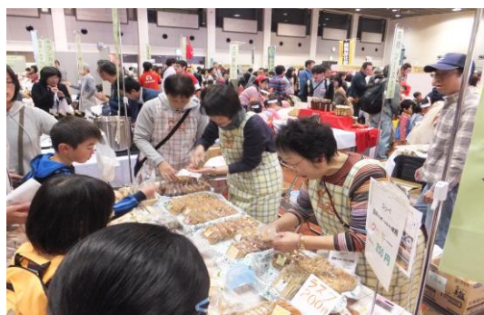
「Wa !わぁ祭り」会場の様子

ビやラジオなどで対外的な告知に力を入れました。組合員も、「Wa !わぁ祭り」を地域にアピールする中で、普段利用しているあいコープの商品の良さを再認識でき、それを伝えたいという思いが、友達やご近所さんへのお誘いにつながり、ゲスト来場者を大幅に増やしました。その結果、加入案内ブースには人が途切れず、お祭り会場で23人の方に新規加入していただきました。