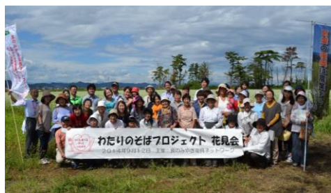
9/12(金)に開催した「わたりのそばの花見会」