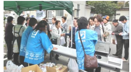
受付で全国からのプレゼント（支援品）を受け取る石巻と東松島の参加者

全国の医療福祉生協の仲間から、たくさんの支援品が届けられ、予期しなかったプレゼントに、みんなの笑顔がほころびました。恒例の「大抽選会」で引かれた当選番号に一喜一憂し、買い物や景品を手に帰途につく組合員の笑顔と姿がとても爽やかでした。