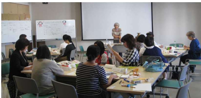
気軽なユニセフ入門講座～UNICafeの様子

「STAND UP TAKE ACTION」URL http://www.standup2015.jp/