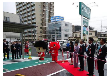
テープカットの様子

当日は「開店を待ってたのよ！」の声が多数寄せられました。メンバーの期待に応えられる店づくりのため、コープ商品やめぐみ野品のお知らせなど、