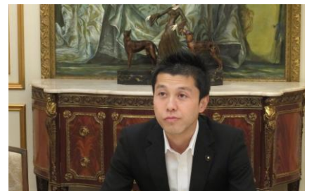
境恒春県議会議員 (県生協連参加者5人)