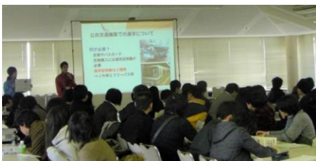
昨年の説明会の様子

より1ヶ月早めて11月23日(日)で準備をすすめています。この説明会を始めたのは、2010年新入生からで、今期で6年目になります。当初は、それほど来場者もないだろうと思っていたのですが、毎年多くの新入生、保護者の方にお越しいただいています。内容は、大学生活と入学準備提案(生協・共済加入、パソコン、運転免許)について、70分程度で行っています。毎日を大学の中で過ごしていると、すべてのことが当たり前と感じてしまいます