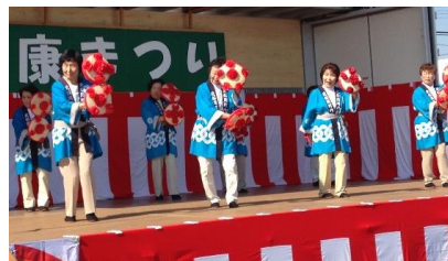
組合員による花笠踊り

10月19日（日）秋晴れの中、約1,800人もの参加で盛大に、「第16回健康まつり」が開催されました。去年は雨の中での開催ということもあり、その鬱憤を晴らすような晴天となり、組合員の意気込みもいつも以上でした。ステージでは、各支部がそれぞれ練習した成果を思う存分発揮し、皆さん満足した笑顔でいっぱいでした。三課題（仲間ふやし、増資、班会開催）達成の表彰では22班、増資も80軒も