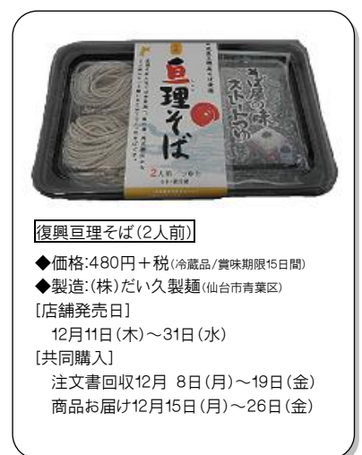
復興亘理そば(2人前)