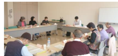
平和委員会例会「学習会」の様子

参加者からは「集団的自衛権の意味がよくわかった」「憲法 9 条の持つ力、意味がよくわかった」「二度と子どもたちを戦場におくらないようにすることが私たち親世代の責務ではない