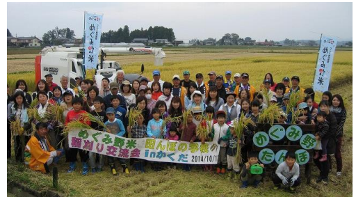
「稲刈り交流会 in かくた」

その後、「つや姫」を使ったおにぎりやお雑煮、お煮付けなどのほか、自分たちで杵と臼を使