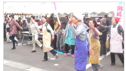
「祝い酒」「東京音頭」に合わせて健康体操